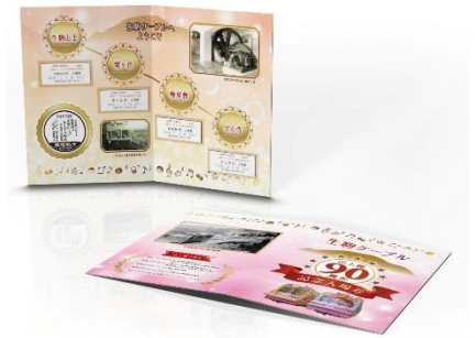
記念入場券セット（イメージ）