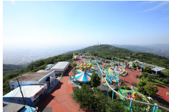
生駒山上遊園地 景観②