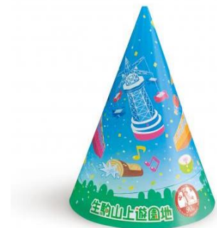
オリジナル三角帽子(イメージ)