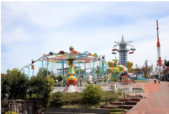
生駒山上遊園地 景観①