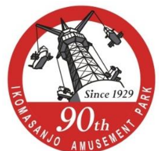
ステッカー（イメージ）